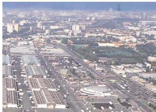
vue aérienne du MIN de Rungis

Notre groupe conteste fondamentalement l'idée que les choix de l'innovation et de la qualification impliqueraient la rarefaction de l'emploi. Le troisième concerne la façon de sortir de