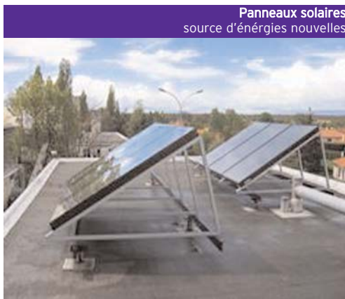
Panneaux solaires source d'énergies nouvelles