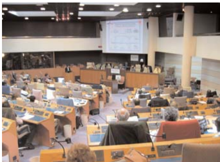
Initiative SDRIF dans l'hémicycle du Conseil régional

autres élu-e-s, de militant-e-s du mouvement syndical et associatif comme il le fait sur tous les dossiers qui appellent des choix lourds de politique publique. Il était aussi d'interroger un certain nombre des chercheurs ou professionnels qui font référence dans leur domaine sur leur façon de relier la lutte contre les inégalités et les enjeux qu'ils ont l'habitude de traiter, qu'il s'agisse de l'environnement, de l'em-